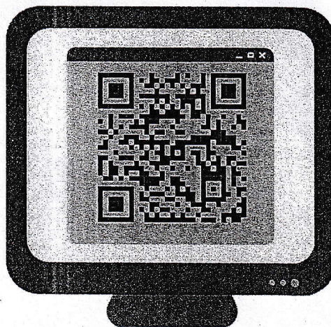
Poster ประชาสัมพันธ์