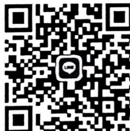
QR Code กลุ่มไลน์เพื่อส่งผลงาน