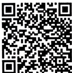
QR Code ใบสมัคร