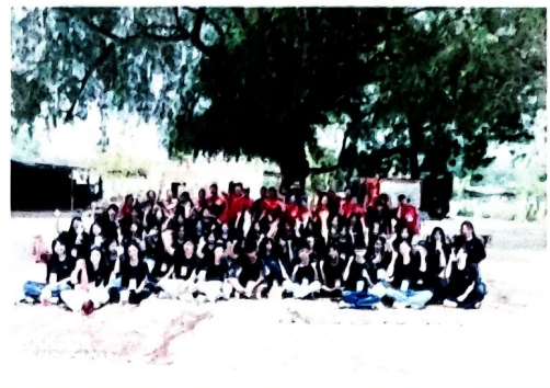
(ศูนย์บริการคนพิการ สมาคมผู้ปกครองบุคคลออทิสติกจังหวัดขอนแก่น)