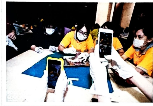
(โรงพยาบาลศรีนครินทร์ คณะแพทยศาสตร์ มหาวิทยาลัยขอนแก่น และ โรงพยาบาลศูนย์ขอนแก่น)