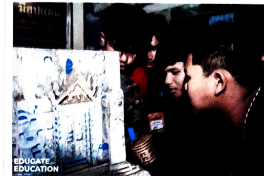
(วัดไชยศรี ตำบลสาวะถี อำเภอเมืองขอนแก่น จังหวัดขอนแก่น)