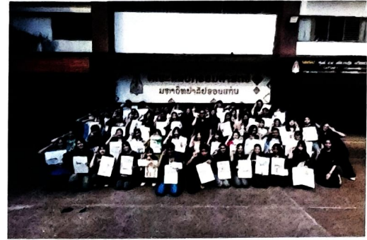
(คณะศิลปกรรมศาสตร์ มหาวิทยาลัยขอนแก่น)