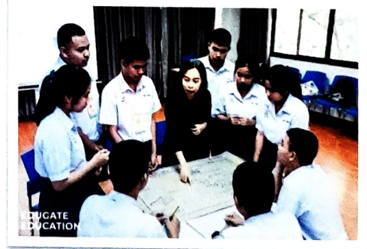
(คณะบริหารธุรกิจและการบัญชี มหาวิทยาลัยขอนแก่น)

บริษัท เอ็ดดูเกท เน็กซ์ จำกัด (0315569000698)