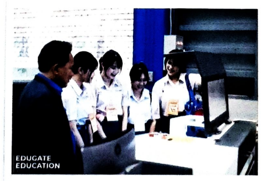
(ศูนย์นวัตกรรมและบริการด้านวิศวกรรม มหาวิทยาลัยขอนแก่น)

บริษัท เอ็ดดูเกท เน็กซ์ จำกัด (0315569000698)