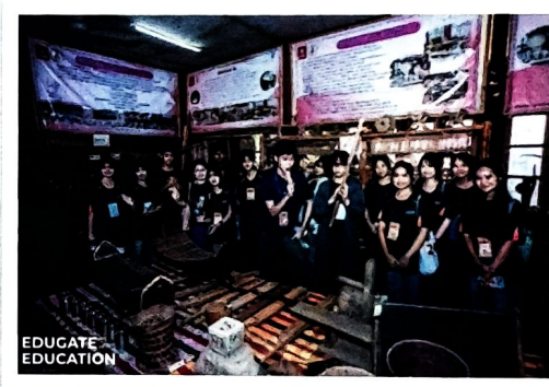
(โรงเรียนบ้านสาวะถี สาวัดดีราษฎร์รังสฤษดิ์ และ พิพิธภัณฑน์ภูมิปัญญาสาวะถี)